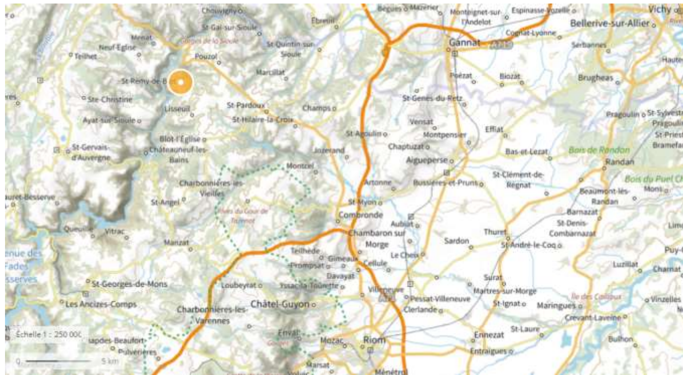
Carte 1 : Plan de situation (1/250 000)